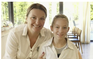
Alma im Service